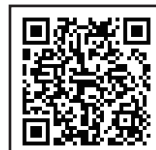
申し込みはこちら